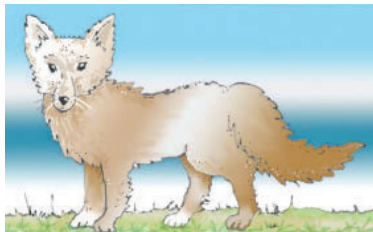
© piirros: Heli Naskali / väritys: IA

Yhtäkkiä Outi ilmaisi äänekkäästi näkevänsä baanan alla liikettä: – Naaleja! Ja totta tosiaan, kaksi takkurturkkista napakettua tuijotti meitä ja eväitämme ahnaan hölmistynein ilmein, mutta lähtivät sitten jolkuttamaan ylös rinnettä.