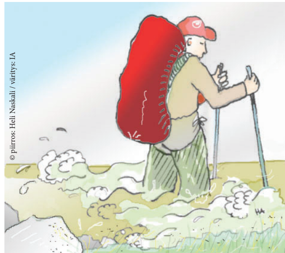
© piirros: Heli Naskali / väritys: IA

Repusta löytyi kuivaa varavaatetta, joten selvittiin säikähdyksellä. – Eikö kukaan saanut valokuvaa? Oli Kaarinan ensimmäinen kysymys. Ainoat menetykset haaverista olivat Ramin koskeen pudonnut sauva sekä Kaarinan lättöjauhe, joka levisi iloisesti rinkan pohjal- le.