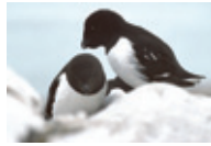
Pikkuruokki Alle alle

Alli Clangula hyemalis Haahka Somateria mollissima Harmaalokki Larus argentatus Isokihu Stercorarius skua Isolokki Larus hyperboreus Jäälokki Pagophila eburnea Jääkuikka Gavia adamsii Kaakkuri Gavia stellata Kiiruna Lagopus mutus hyperboreus Lapintiira Sterna paradisaea Leveäpyrstökihu Stercorarius pomarinus Lunni Fratercula arctica Lyhytnokkahanhi Anser brachyrhynchus Merilokki Larus marinus Merikihu Stercorarius parasiticus Merisirri Calidris maritima Myrskylintu Fulmarus glacialis pikkukajava Rissa tridactyla pikkuruokki Alle alle Pohjankiisa Uria lomvia Pulmunen Plectrophenax nivalis Pulmussirri Calidris alba Riskilä Cephus grylle Suosirri Calidris alpina Tiiralokki Larus sabini Tukkakoskelo Mergus serrator Tunturikihu Stercorarius longicaudus Tylli Charadrius hiaticula Valkoposkihanhi Branta leucopsis