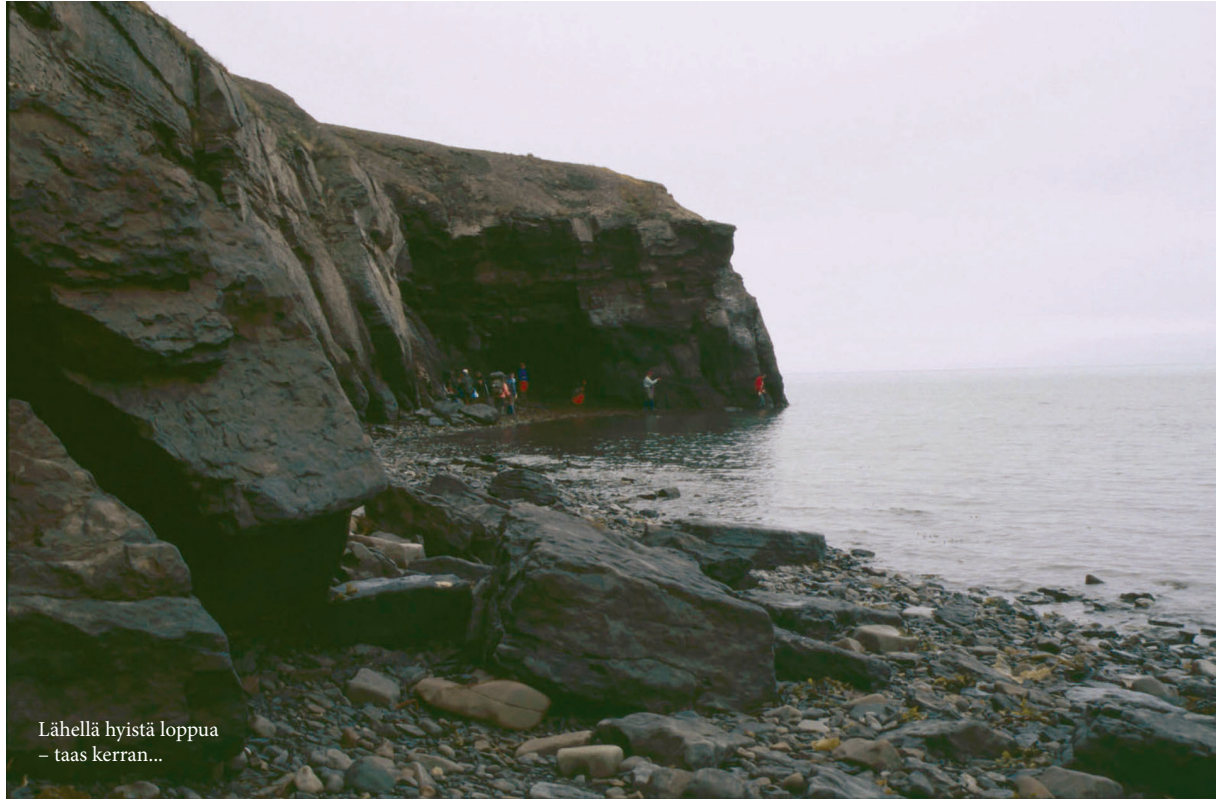
Lähellä hyistä loppua – taas kerran...

Noustiin rantapenkalle, jossa hielenkuljetukseen käytetty puolimätä "tunnelbaana" toimi suunnannäyttäjänämme useita kilometrejä. Milloin kävelimme sen vieressä, milloin sitä pitkin, milloin sen sisällä. Sisällä kulkemisessa oli se huono puoli, että korkeat rinkat tahtoivat pisimmillä miehillä takertua katon tukirakenteisiin. Myös aukoista sisälle talvella tuprutanut lumi oli paikoin kinostunut niin korkeaksi, että oli pakko jatkaa taas ulkopuolella – väliin upottavassa maastossa. Jätöksistä päätellen naalit käyttivät tunnelia kokoontumis- ja lymyapaikkanaan.