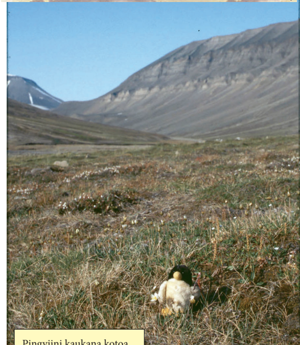
Pingviini kaukana kotoa...