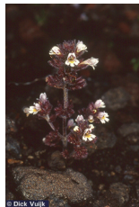
Pohjansilmäruoho Euphrasia frigida

Arktinen voikukka Taraxacum arcticum Arnikki Arnica angustifolia Hanhikkilaji Potentilla hyparctica Hapro Oxyria digyna Huippuvuorten unikko Papaver dahlianum Jäämerentähtimö Stellaria humifusa Karvakuusio Pedicularis hirsuta Karvasinilatva Polemonium boreale Ketunlieko Hyperzia selago Kultakynsimö Draba alpina Lapinnätä Minuartia biflora Lapinkissankello Campanula rotundifolia gieseckiana Lapinkynsimö Draba lactea Lapinvuokko Dryas octopetala Lettorikko Saxifraga hirculus Liekovarpio Cassiope tetragona Lumileinikki Ranunculus nivalis Merihalikka Mertensia maritima Mätäsrikko Saxifraga cespitosa Napahärkki Cerastium arcticum Napapaju Salix polaris Nuokkurikko Saxifraga cernua