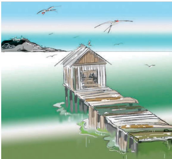
© piirros: Heli Naskali / väritys: IA

Rantamaisemaa hallitsi valtava, lähes sata metriä pitkä puurakenteinen laiturirumilus, jonka jäät ja merenkäynti olivat aikoja sitten katkaisseet keskeltä kahtia ja jättäneet ulomman pään kiviarkkuineen ja torneineen irvokkaasti kallelleen. Nyt laituria ja koko rantaa asutti vihainen lapintiirayhdyskunta, joka terrorisoi lähes tyjiä perille saakka viedyillä nokaniskuilla! Jos niiden reviiirillä mieli kävellä, oli pakko pitää vaellussauvaa korkealla päänsä yläpuolella.