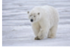
Jääkarhu Ursus maritimus

Huippuvuorten peura Rangifer tarandus platyrhynchus Jääkarhu Ursus maritimus Mursu Odobenus rosmarus Partahylje Erignathus barbatus Naali Alopex lagopus