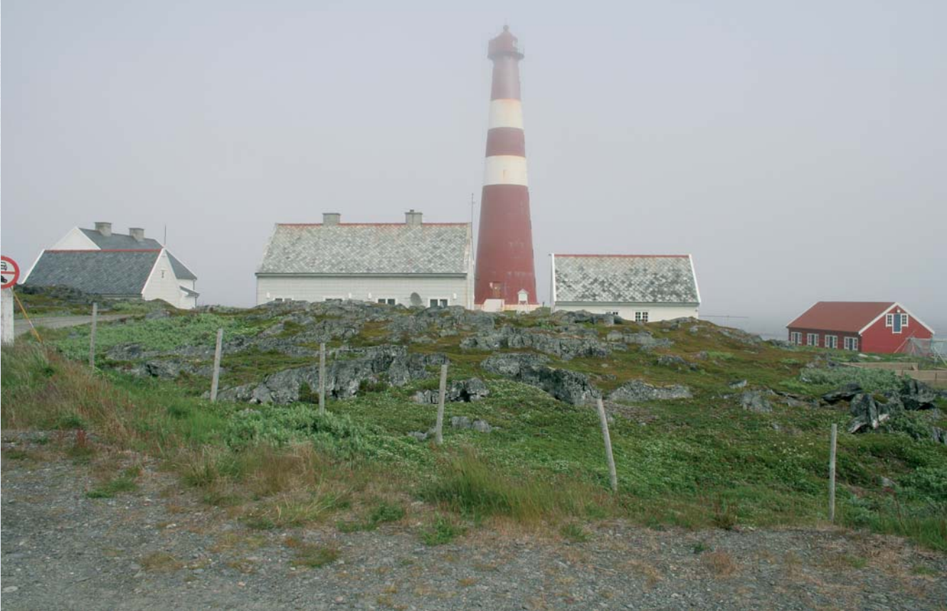
Slettnesin majakka, sumuisena niin kuin me sen näimme.

Gamvikin pienestä kalastajakylästä on retkemme päätepisteeseen Slettnesin luonnonsuojelualueelle matkaa noin kolme kilometriä, ja siellä sijaitsee sen näkyvin kohde majakka, joka on suojelualan keskellä. Alue on kooltaan pieni, vain noin 12 neliökilometriä. Yleisilmeeltään Slettnesin niemi on kallioista ylänkömaastoa, joka muuttuu rantaa lähestyttäessä pääasiassa alavaksi, kohtalaisen helppokulkuiseksi maaksi. Niemessä oleva majakka on, ei ainoastaan Euroopan, vaan maailman pohjoisin mantereella sijaitseva majakka. Paikan tarkka sijainti on 71,05,33 N / 28,13 E. Majakka on toimiva, tosin ei enää miehitetty. Sen vieressä olevat vanhat rakennukset ovat nyt yksityiskäytössä, ja siellä on ymmärtääkseni myös mahdollis-