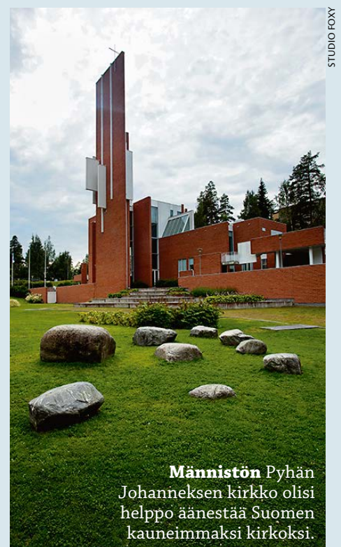
Männistön Pyhän Johanneksen kirkko olisi helppo äänestää Suomen kauneimmaksi kirkoksi.

Männistön Pyhän Johanneksen kirkko valmistui vuonna 1992. Vanha Männistön kirkko jäi suosituksi juhla kirkoksi, kunnes seurakuntayhtymä myi kiinteistön Suomen ka-