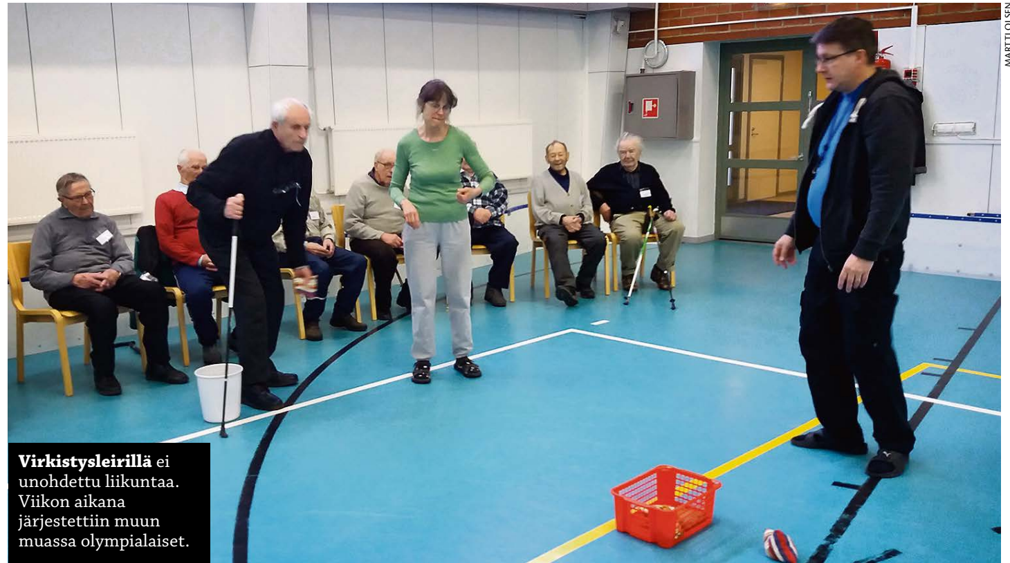
Virkistysleirillä ei unohdettu liikuntaa. Viikon aikana järjestettiin muun muassa olympialaiset.

”Tämmöiset leirit ovat hyviä. Se suru, joka kuuluu menetykseen, murenee pala palalta antaen helpotusta elämään. Vähitellen as-