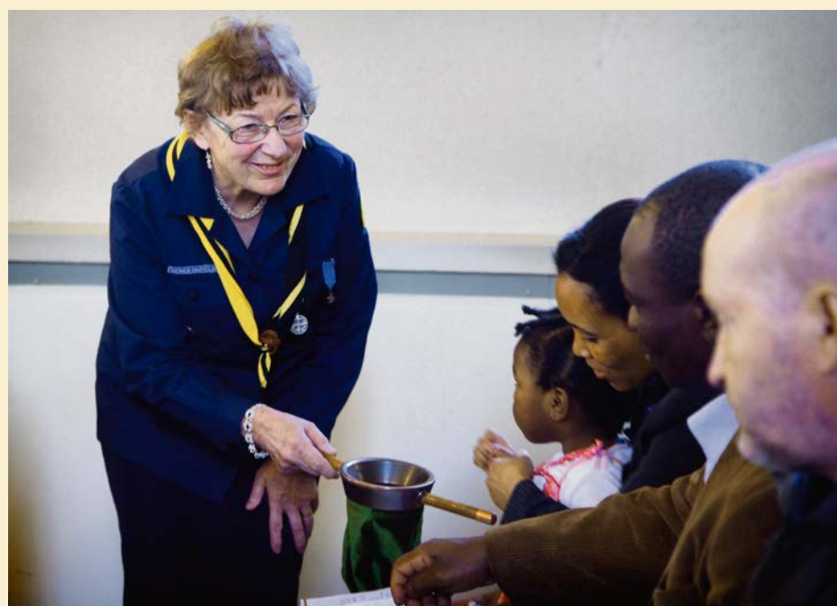
Tekemistä löytyy vaikkapa kolehdinkantajana.

Kolehtia osaa kantaa kaikki ja jakaa virsikirjoja, samalla kun toivottaa tervehdyksi kirkkoon. Mukava puuha pyhäamuna. Tekstien lukijoista ja esirukouksen avustajista on jatkuva tarve. Samoin kirkkokahvien järjestäjistä. Ehtoollista