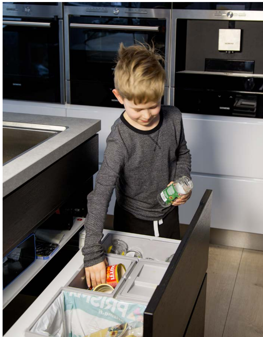
JäteKukon nettisivuilla Lajittelun ABC kertoo, mihin lajitella mitkäkin kotitalouden jätteet.

SINI-MARJA KUUSIPALO Kuvitus: TUUIJA HYTTINEN