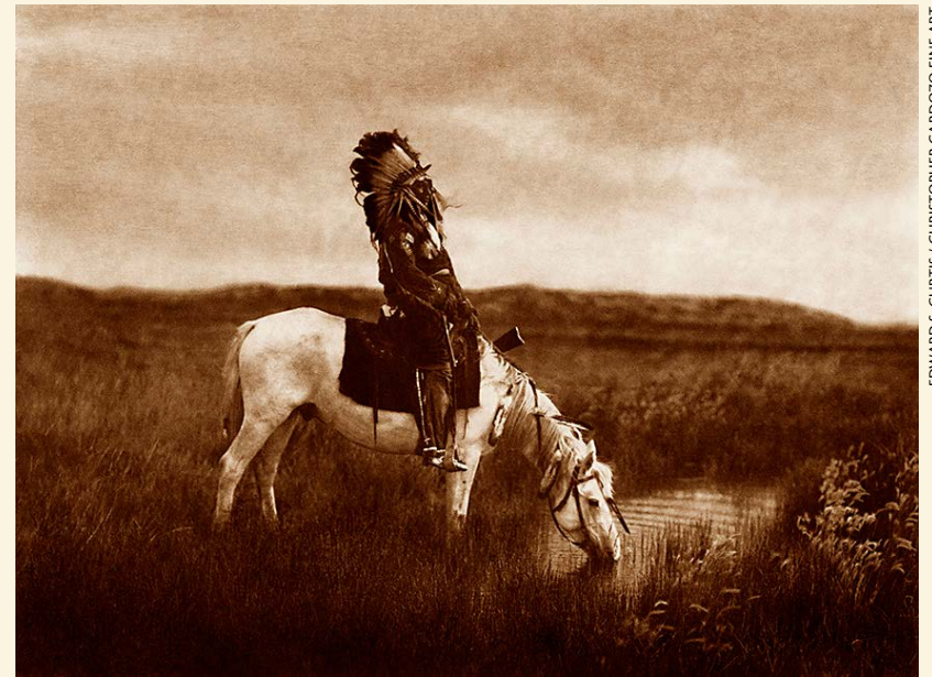
EDWARD S. CURTIS / CHRISTOPHER CARDOZO FINE ART.

Lähetä vinkit osoitteeseen kulttuurikulma@gmail.com kaksi viikkoa ennen seuraavan lehden ilmestymistä.