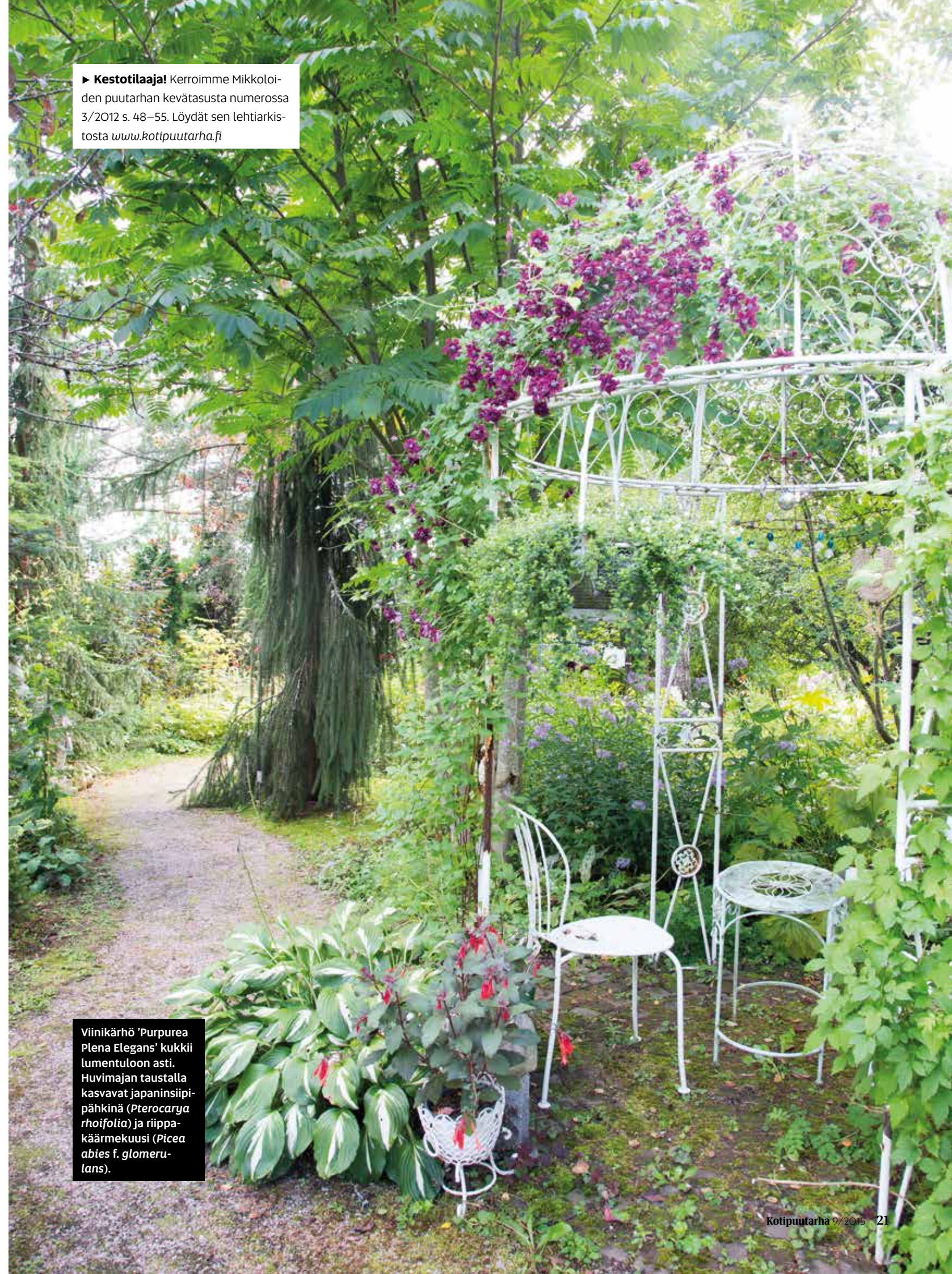
Viinikärhkö 'Purpurea Plena Elegans' kukkii lumentuloon asti. Huvimajan taustalla kasvavat japaninsiipipähkinä ( Pterocarya rhoifolia ) ja riippakäärmekuusi ( Picea abies f. glomerulans ).

► Kestotilaa! Kerroimme Mikkoloiden puutarhan kevätasusta numerossa 3/2012 s. 48–55. Löydät sen lehtiarkistosta www.kotipuutarha.fi