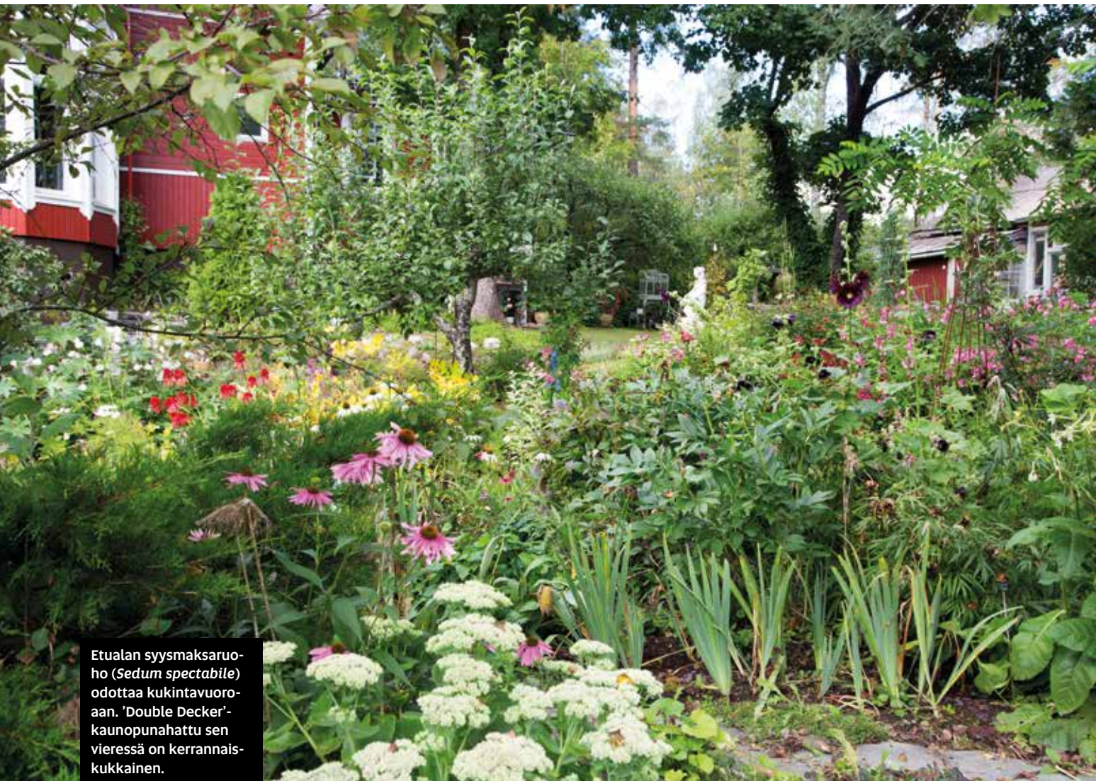
Etualan syysmaksaruo- ho ( Sedum spectabile ) odottaa kukintavuoro- aan. "Double Decker"- kaunopunahattu sen vieressä on kerrannais- kukkainen.