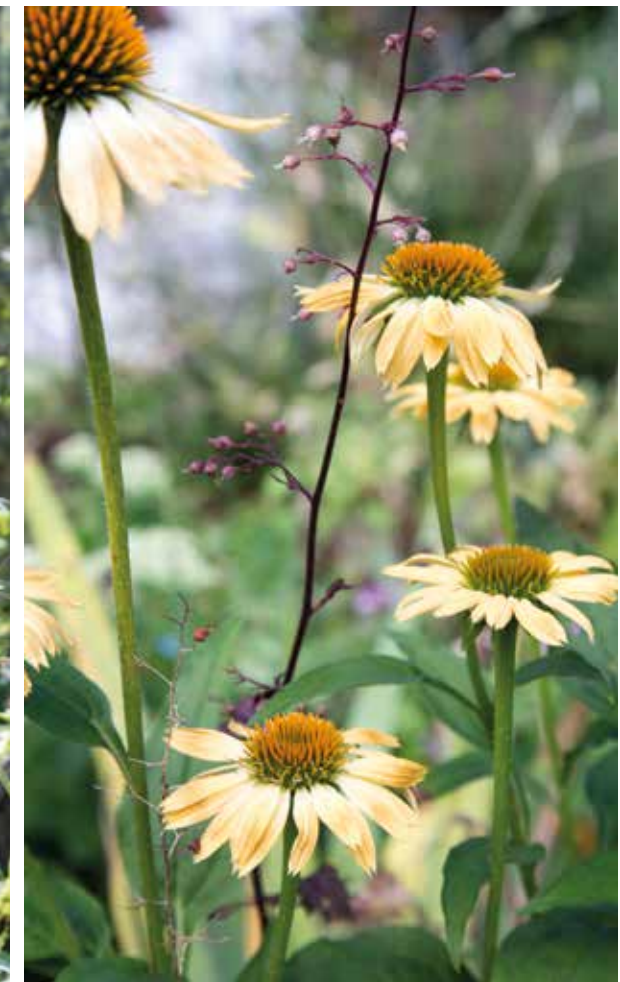
← Tarhapunahattu risteymä 'Sunrise' ( Echinaceae x hybrida ) sopii väriältään hyvin liilan keijunkukan kumppaniksi.