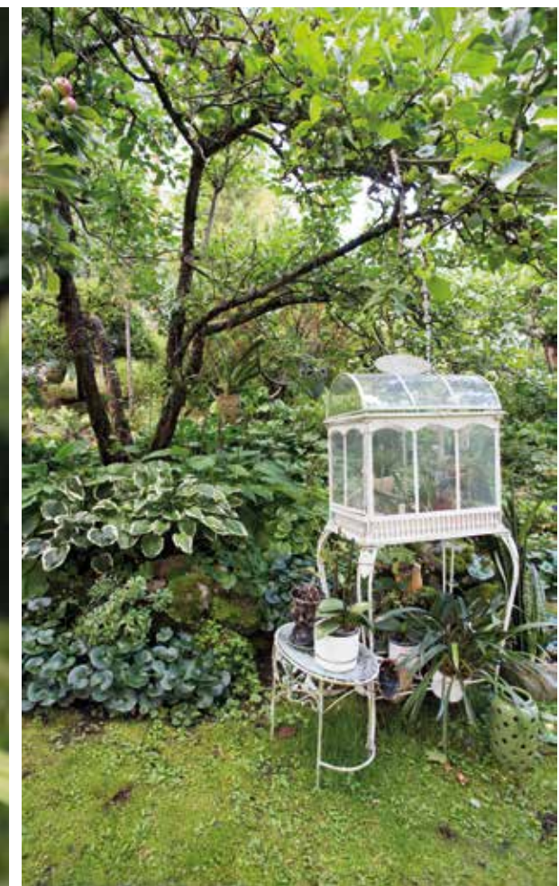
← Omenapuun lempeään varjoon tuotu pienoiskasvihuone on sopiva orkideoiden ja tillandsioiden kesäpaikka.