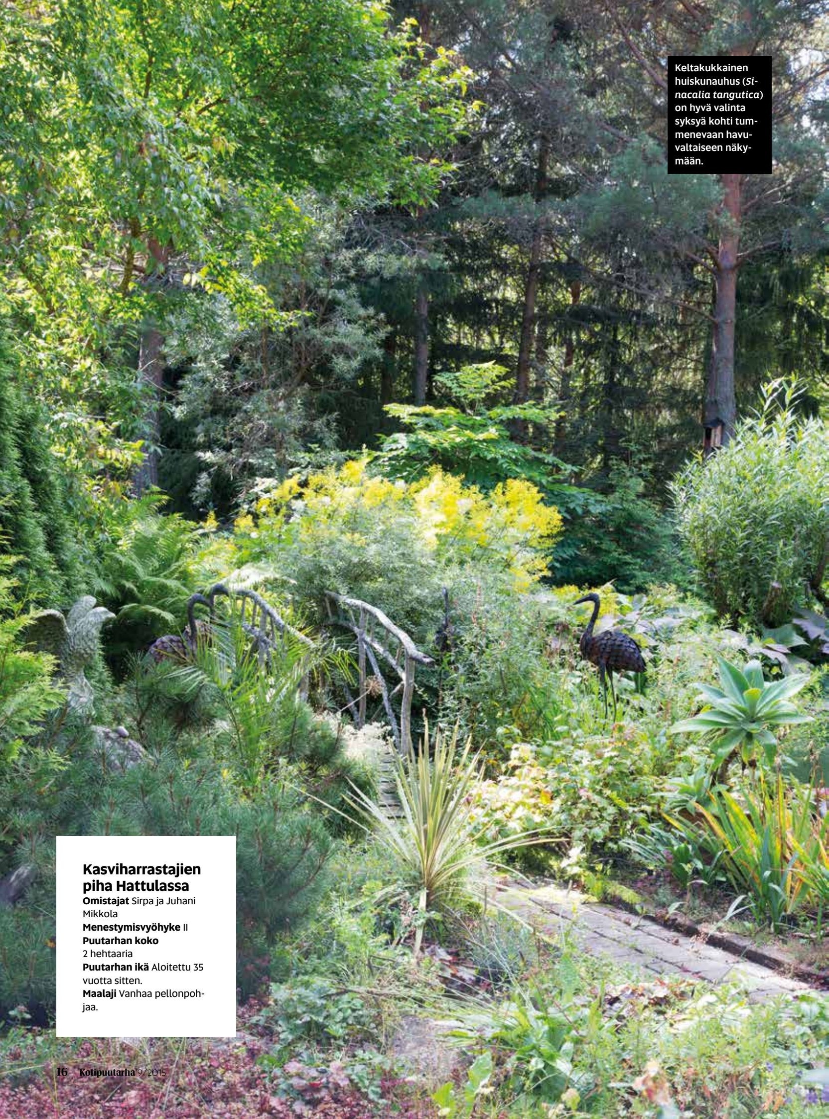
Keltakukkainen huiskunauhus ( Sinacalia tangutica ) on hyvä valinta syksyä kohti tummenevaan havuvaltaiseen näkymään.