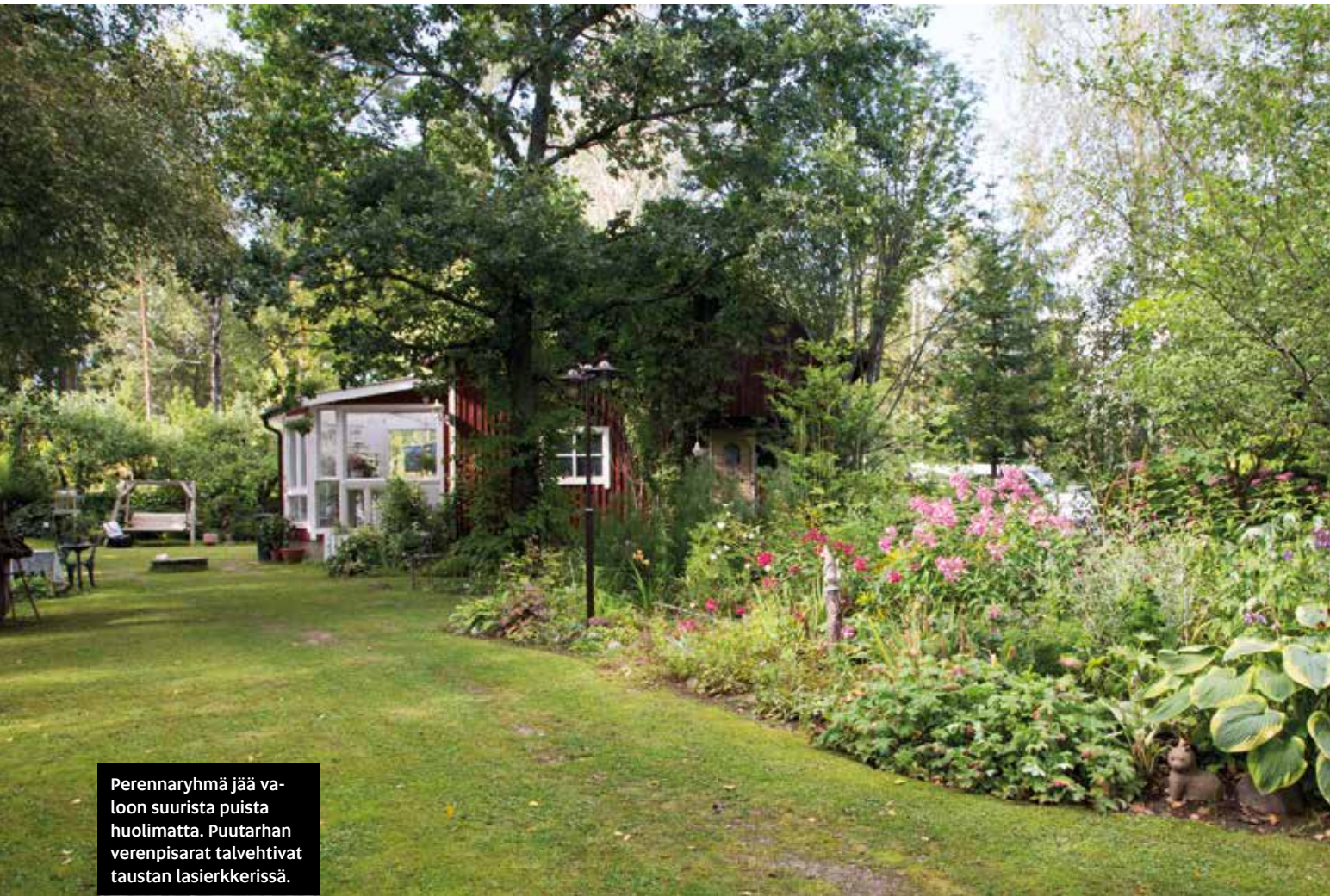
Perennaryhmä jää valoon suurista puista huolimatta. Puutarhan verenpisarat talvehtivat taustan lasierkerissä.