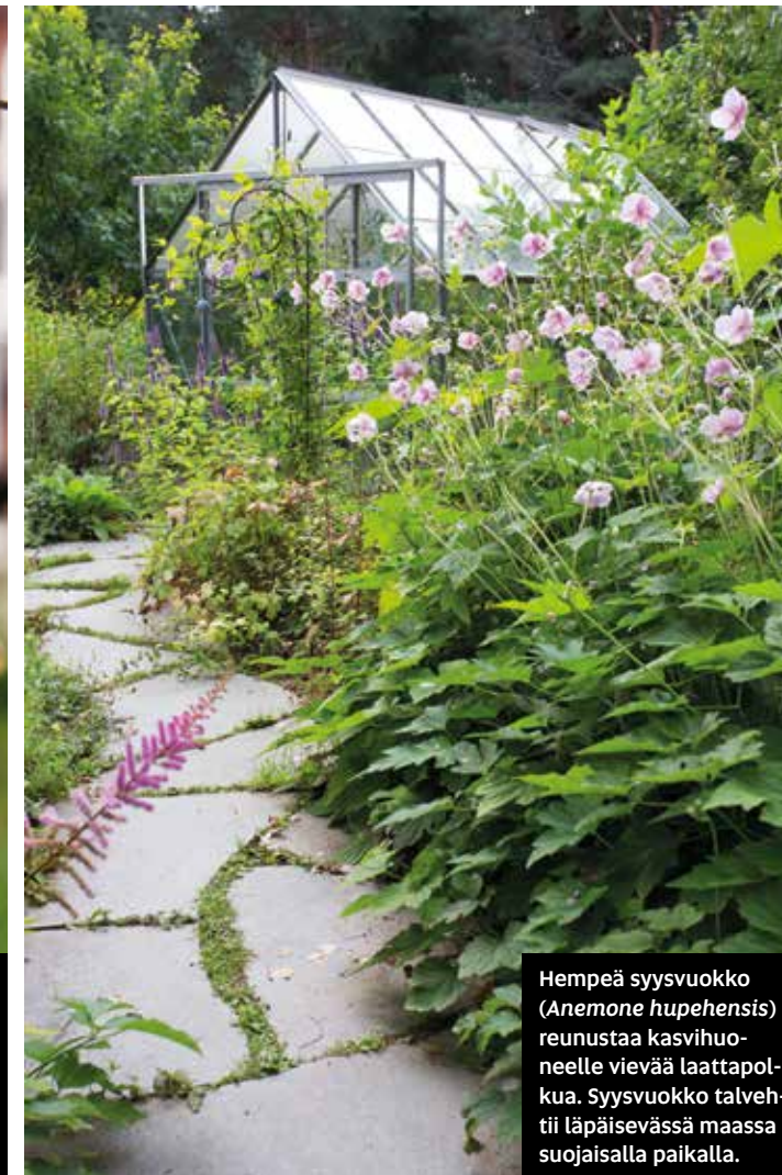
Hempeä syysvuokko ( Anemone hupehensis ) reunustaa kasvihuoneelle vievää laattapolkua. Syysvuokko talvehtii läpäisevässä maassa suojaisalla paikalla.