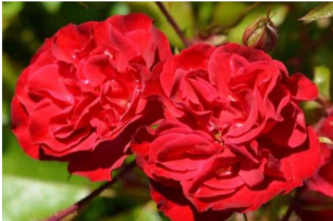
Rosa EASY ELEGANCE® Mystic Fairy