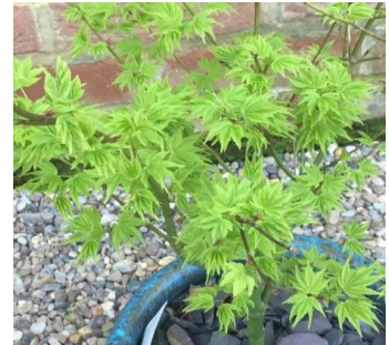
JAPANINVAATHERA 'Going Green'