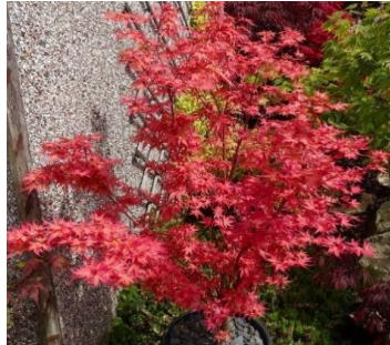
JAPANINVAATHERA 'Momoiro Koyasan'