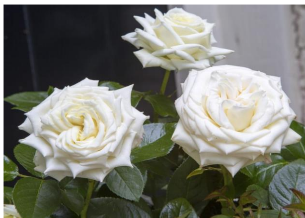
ROSA ISLE OF WHITE Holiday Island Roses