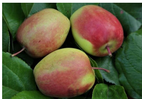
Tarhaomenapuu 'Long Guang'