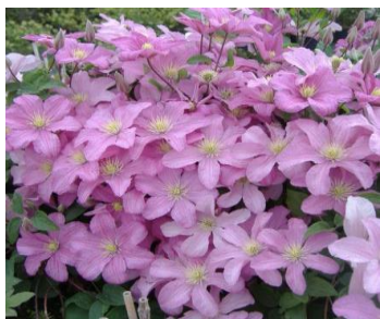
Loistokärhő 'Comtesse de Bouchaud'