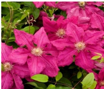
Loistokärhő 'Ernest Markham'