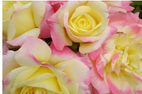
Rosa EASY ELEGANCE® Music Box