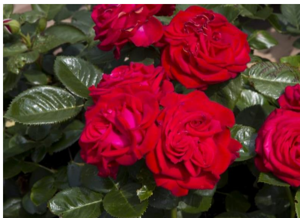
ROSA IBIZA Holiday Roses Teehybridi