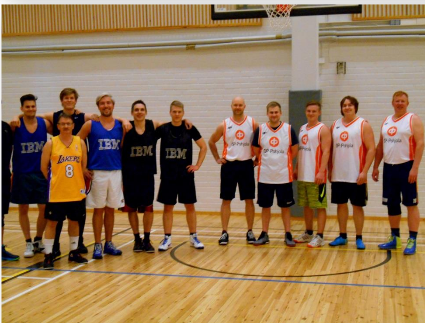
IBM – POHJOLA yhteiskuvassa Kunniasarjan voitti POHJOLA