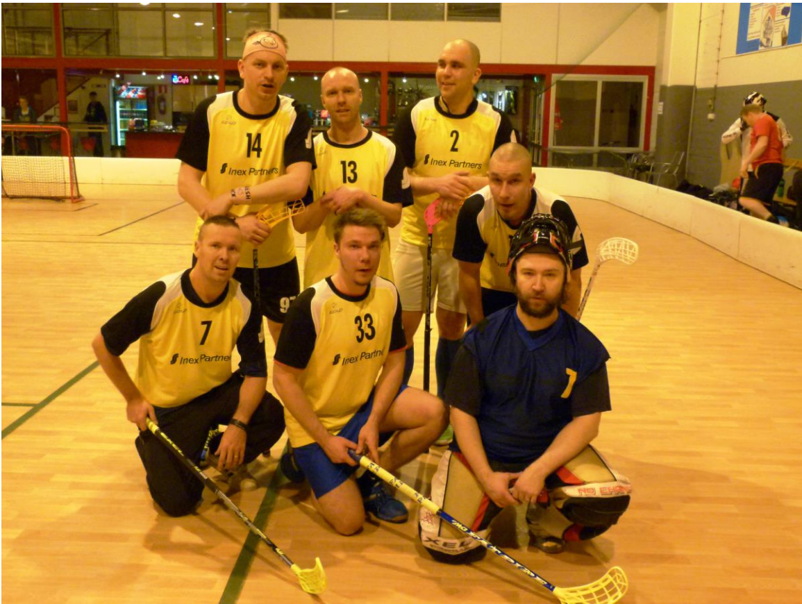
Kuvassa INEXIN joukkue

Sarjaan lähti 6 joukkuetta. Pelasimme kaksinkertaisen sarjan (30 ottelua). Tänäkin vuonna sarja oli varsin tasainen ja jännitys säilyi viimeiselle kierrokselle asti. OSB (Orion) selvisi voittajaksi pisteen erolla EPUun (Pelastuslaitos) . AKG Espoo puolestaan pisteen vähemmän saaneena jäi kolmanneksi. Neljäs sija meni INEXille ja viides, Doro voitti pisteellä tällä kertaa peränpitäjäksi jääneen Taren .