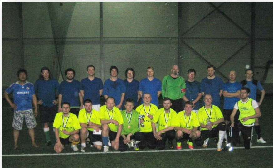
R.R PUTKI ja POSTI