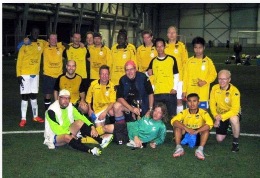
FC ASKEL cupin kakkonen