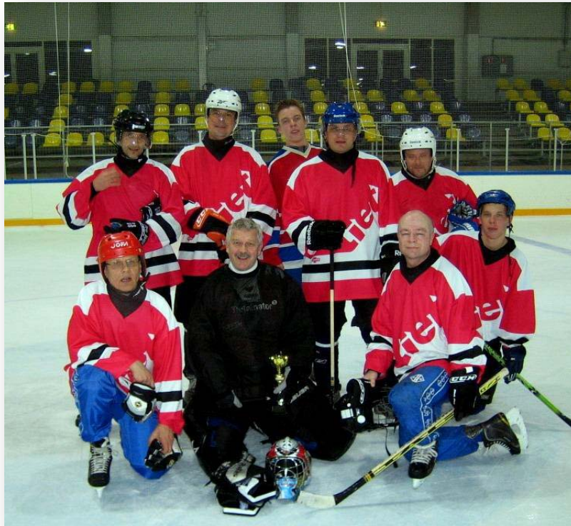
Reilun pelin joukkueena palkittiin TIETO OYJ