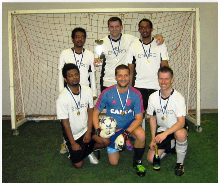
Kakkosen voittaja ENORO