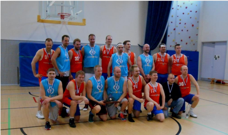
Mitalisarjan kulta ja hopeajoukkueet LÄHITAPIOLA-HELEN yhdessä