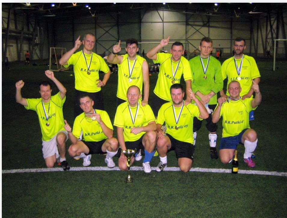
TEA:n tuplamestari R.R. PUTKI

Kauden aikana pelipaikan omistuspohja muuttui. Espoon Jalkapalloareena Oy on nyt EBK- HONKA AREENA. Yhteistoimintamme jatkuu hyvissä merkeissä.