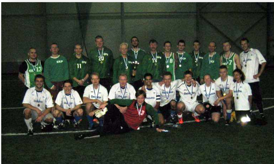
DELOITTE ja EPU