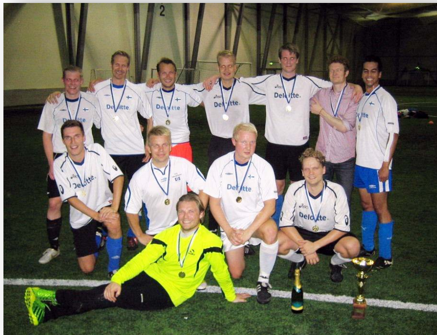
Ykkösen voittaja DELOITTE