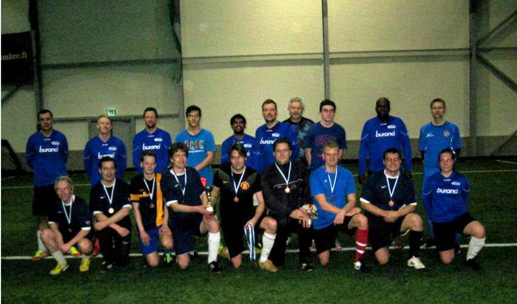
Kuvassa VTT ja ORION

Vuoden 2015 turnaus pelattiin lauantaina 21.2 kello 17.00 – 21.00 A-LINK AREENASSA Espoossa. Ottelut pelattiin kilpasarjassa ( mukana 4 joukkuetta ) ja kuntosarjassa (4 joukkuetta ).