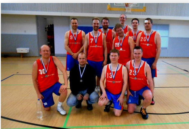
HELEN - Helsingin energian hopeajoukkue