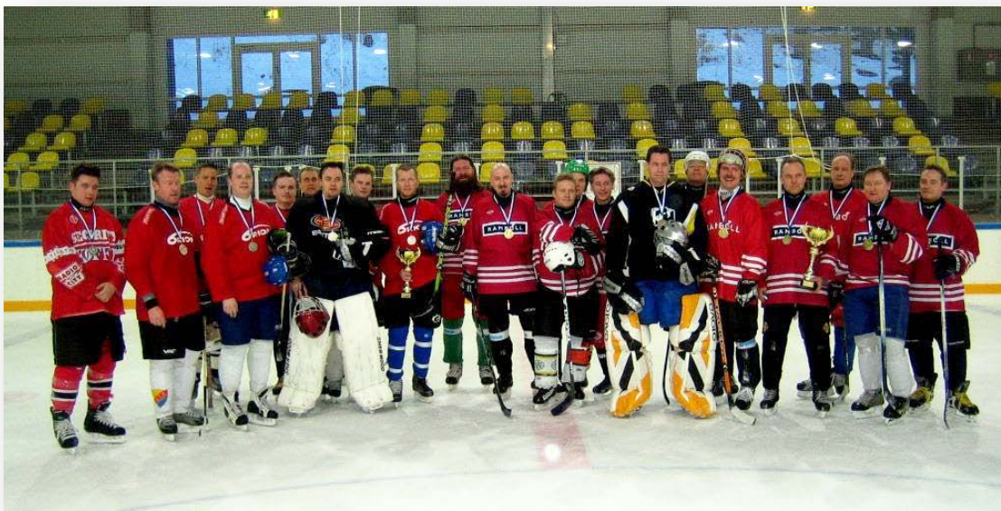
Voittajajoukkue RAMBOLL ja hopeajoukkue ORION