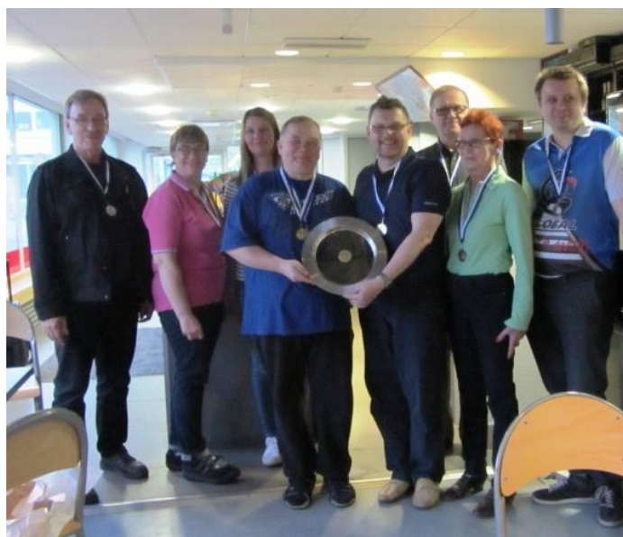
Mitalijoukkueet. Kirkkonummi vas. hopeaa. Veolia kesk. kultaa ja Tapiolan keilahallin joukkue pronssia.