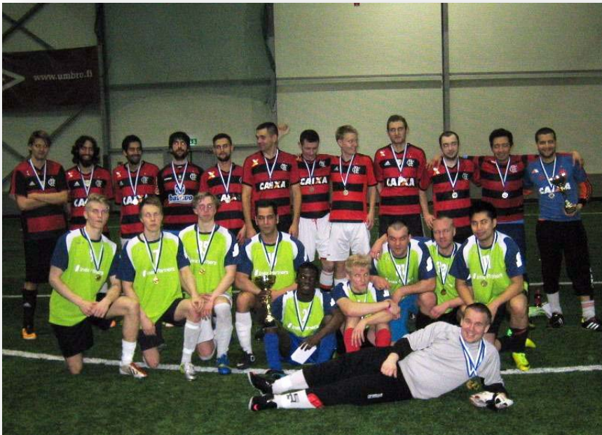
INEX ja FLAMENGO